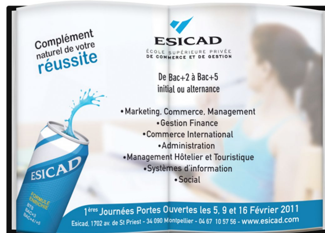
Illustration d'exemple d'une Double-Page